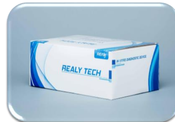
Caja 25 unidades kit